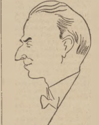
LEON DEGRELLE przywódca faszystów belgijskich. PRZEWIDYWANIA.

Kardynał Van Roey, prymas Belgii, wysłał otwarte pismo do wszystkich katolików. Pismo oświadcza, że rexisizm stanowi niebezpieczeństwo dla kraju i dla kościoła. Obowiązek wszystkich lojalnych katolików w dniu wyborów jest zatem jasny. Wszelka abstynencja przy głosowaniu, włms spotkać się z potępieniem