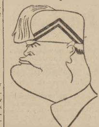
MUSSOLINI z którego polecenia zerwano mecz Francja - Włochy.