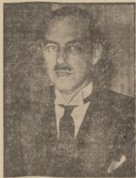
VAN ZEELAND kandydat demokracji belgijskiej.