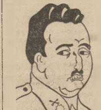
GEN. FRANCO którego wojska poniosły nową klęskę pod Madrytem.

Po stronie wojsk generała Franco: 130.000 falanżników, 100.000 karlistów, 40.000 żołnierzy armii regularnej, 125.000 wojsk mrokańskich, 77.000 Włochów, 30.000 Niemców. Razem 395.000 ludzi.