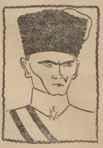
Prezydent Tursji Ałaturk

sra, Rustu Arasa, do Bagdadu, Teheranu i Moskwy.