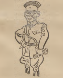
GEN. MOLA Dowóda wojsk faszystowskich na froncie baskijskim.

z książką „zaklętego wroga ludu”. Nazwiska autora dziennik nie wymienia, ażeby nie stać zgorzniecia, gromi natomiast kierowników tych skłupów, oskarżając ich o niedbalstwo polityczne, które prowadzi do tego, że skłupy kairują i tworzą literaturę kontr-rewolucyjną. (PAT.)