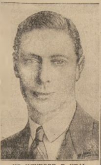
KS. WINDSOR, B. KRÓL EDWARD VIII.