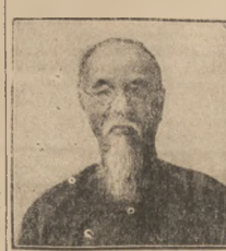
PREZYDENT CHIN LIN - SUN.

Nowomianowany ambasador włoski w Chinach Giulio Sora wręczył wczoraj prezydentowi centralnego Rządu chińskiego Lin-Senowi swe listy uwierzytelniające w imieniu króla Włoch i cesarza Abisynii. W odpowiedzi swej prezydent ograniczył się do wyimienienia tylko tytułu króla Włoch