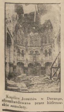
Kaplica Jezuistów w Durango, zombardowana przez hitlerowskie samoloty.