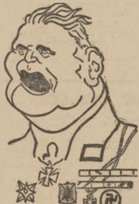
GEN. GOERING, szef lotnictwa Rzeszy.