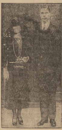
KRÓL JERZY VI KORONA ELŻBIETA.

dali na nim podczas uroczystości koronacyjnych wszyscy królowie angielscy, z wyjątkiem królowej Marii I i Marii II. Nawet Cromwell, gdy został ogłoszony Westminster Hall królem protektorem, został przyjeźdźcą z opactwa kresło kr. Edwarda i zasiadł na nim, jak to czynią królowie podczas intronizacji.