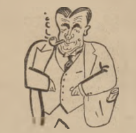
BALDWIN, szef Rządu angielskiego.