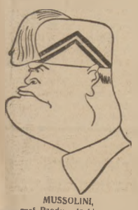
MUSSOLINI, szef Rządu włoskiego.

Wszystkie gazety angielskie zakazane we Włoszech