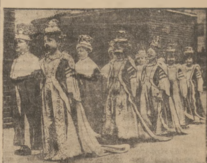
ZABAWY DZIECI LONDYŃSKICH W „KORONACJI”.