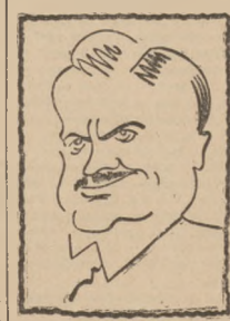
MOŁOTOW. Na kolejnym posiedzeniu rady komisarzy ludowych Z.S.S.R. pod przewodnictwem Molotowa były omówione m. in. następujące sprawy: 1) produkcja przemysłu papier-

niczego. Rada stwierdziła, iż w pierwszym półroczu 1937 roku, a ostatnie lat nie wykonywał planu produkcji ani pod względem ilościowym, ani jakościowym. Główne przyczyny tego faktu tkwią w złej organizacji przedsiębiorstw, oraz w nieodpowiednim kierownictwie ze strony ludowego komisariatu przemysłu leśnego.