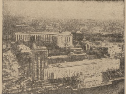
OGÓLNY WIDOK W WYSTAWY PARYSKIEJ.

CACIOWIA NA CZELE LIGI. Dzięki zwycięstwu nad Wartą, Ora-