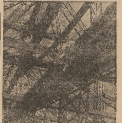
Jednym z cudów wystawy paryskiej będzie atacja telewizji. Na naszym zdjęciu monowanie stacji nadawczej na szczyście wleży Eiffa.