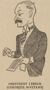
PREZYDENT LEBRUN OTWORZYŁ WYSTAWĘ

W poniedziałek przeciągnęła nad powiatem morskim olbrzymia chmura wazek. Rozciągnęła się ona na przestrzeni kilku kilometrów, miejscami była była tak gęsta, że motocykliści musieli zatrzymać maszynę, nie mogąc się przebić przez zwalony opad. Ciąg opadów trwał około godziny.