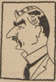
NOWY PREMIER NEVILLE CHAMBERLAINE.

Nowy premier przeprowadził się na Downing Street wraz ze swym osobistym archiwem, w tym samym mniej więcej czasie Baldwin wyjeżdża do Aix les Bains, gdzie przeprowadzi kurację.