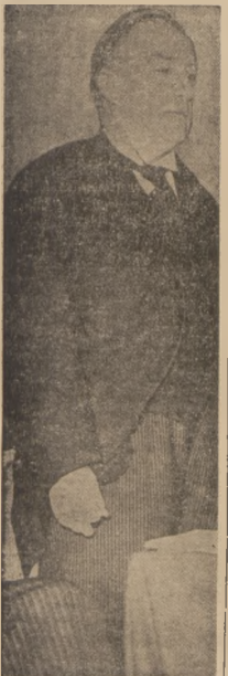
USTĘPUJĄCY PREMIER STANLEY BALDWIN.