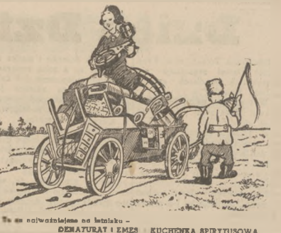
W ten sposób została oblatana — DEMATURAT I EMES KUCHEWKA SPIRITUSOWA

Brak miejsca nie pozwala nam na cytowanie bez końca tej ciekawnej książki, planęj dla samego drobnomieszczanśtasza. Pragnie ona śladomidek dla filisterskiej portret „wódza Niemiec”, przedstawiając go jako pełnego cnotek i sposobu, jak i pisano w cytowanych wszystkich zaboborów o „naszym cesarzu”. Oczywiście wolno i tak: Ale nas Interesuje pytanie, kto odpowiada za te podjężraną imprezę wydawniczą? Al. Dek.