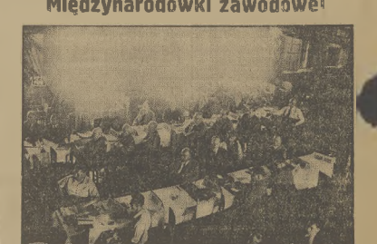
Fragment sali w czasie otwarcia oora