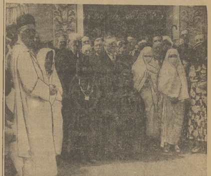
Na naszym zdjęciu widzimy fragment z uroczystego otwarcia pawilonu Algieru na Wystawie Paryskiej. Na te uroczystości przyjechali liczni tułacy z Algieru.