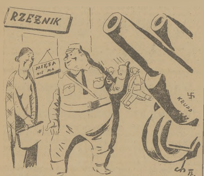
RZEŹNIK: Mięsa nie ma, nie będzie, bo są armaty.