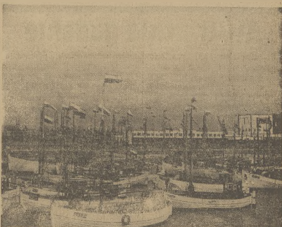
Nasze zdjęcie przedstawia polską flotylę rybacką w porcie gdynskim. Na łodziach z okazji Święta Morza wywieszono flagi o barwach narodowych.