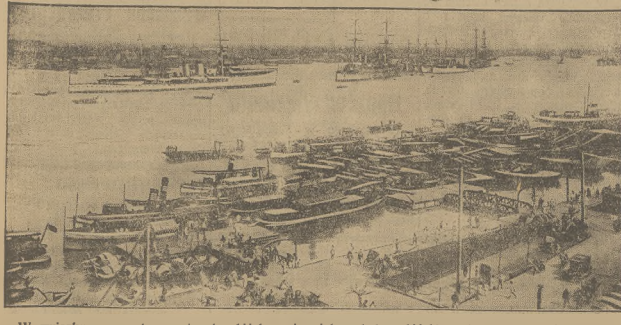
W związku z nagrzoną sytuacją chińsko - japońską władze chińskie nakazały wnieść barykady z worków z piaskiem w dzielnicy Czapei w Szanghaju, zwłaszcza dookoła dworca północnego. Dla ułatwienia ruchu wojsk chińskich przewóz towarów kolejami do Chin północnych ma być ograniczony lub nawet zawieszony. Na naszym zdjęciu ogólny widok portu w Szanghaju.