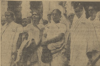
Zdjęcie nasze przedstawia kobiety indyjskie — członkinie Indyjskiego zgrupowania ustawodawczego w Bombaju.