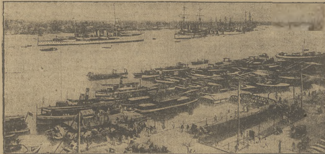
Port w Szanghaju

Koncesja japońska w Szanghaju jest otoczona barykadami z warów napełnionych piaskiem, oraz zagrodami z drutu kolczastego. Władze koncesji francuskiej zawiadomy władze chińskie, że w razie przelotu chińskich samolotów nad koncesją francuską zmuszone będą ucieść się do środków obrony.