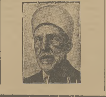
Wielki Mufti Jeruzolimy