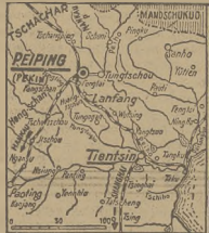
MAPA PÓŁNOCNYCH CHIN. GENERALNY ATAK NA POZYCJE JAPOSKIE.

Według doniesień z Szanghaju, wszystkie oddziały chińskie, otaczające dzielnice japońskie koncepcji międzynarodowej, rozpoczęły wczoraj generalny atak na pozycje japońskie.