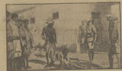
Przez granicę brytyjskiego Somali przechodzi tysiące Abisyńczyków uciekających z zabowanej przez faszystów Abisynii.

dry. Dwukrotnie sytuacja była prawie beznadziejna dla wojsk rządowych (w listopadzie ub. roku, oraz w lutym bież. roku). Wojska rządowe wspomaganie dywizjami międzynarodowymi odparły jednak w ostatniej chwili wszystkie ataki faszystów. Ostatnio wojska rządowe podjęły ofensywę, która doprowadziła do częściowego oczyszczenia okolic Madrytu z wojsk gen. Franco.