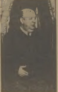
TOW. PRIETO, minister Obrony Narodowej