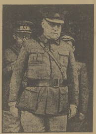
GEN. MIAJA, OBRONCA MADRYTU.

Agencja Domei donosi, że w ciągu ubiegłej nocy w miejscowości Uji w pobliżu Kioto, wyleciała w powietrze fabryka prochu. Dotychczas z pod gruzów wydobyto 22 zabitych i rannych. 800 domków w tej miejscowości uległo całkowitemu zniszczeniu. Dalszych szczegółów na razie brak.