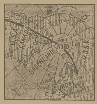
Wszystkie ślady ludowe polarne bez przerwy starają się schwycić sygnały i deszper, nadawane przez samolot Lewoniewskiego. Dotychczas jednakże nie udało się nawiązać połączenia z lotnikami zaginionego samolotu.

Ambasador ZSRR, w Waszyngtonie otrzymał z Moskwy wiadomość, iż radiostacje w Moskwie i w Irkucku przejęły słabe sygnały, pochodzące, jak przypuszczają, od zaginionego lotnika Lewoniewskiego. Obecnie czynione są starania, celem ustalenia, czy radiostacje wojskowe na Alasce i radiostacje kanadyjskie słyszały te same sygnały.