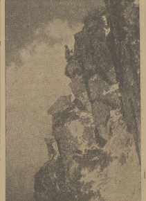
Grupa ratunkowa została za pomocą samolotu...