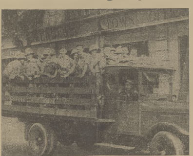
Oddział żołnierzy amerykańskich, przybyły dla ochrony interesów amerykańskich.