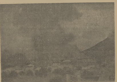
Podstołeczna miejscowość Hoyos de Manzanares, bombardowana przez lotnictwo powstańcze.