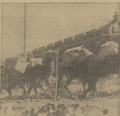
Na niektórych odcinkach frontu chińskiego wobec braku siliskolejowej, Japończy transportują broń na wielbłądach, jak widać na naszym zdjęciu.