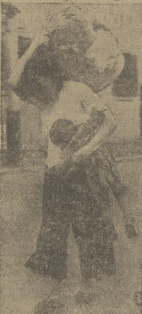
Na zdjęciu widzimy kobiety chińskiej z dziećmi i całym dobytkiem ratującą się ucieczką z piekła szanghajskiego.