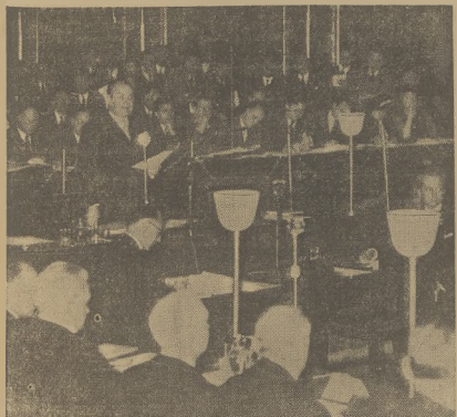
Zdjęcie nasze przedstawia moment otwarcia przez belgijskiego ministra Spraw Zagranicznych Spaaka konferencji dziewięciu mocarstw w Brukseli, poświęconej sprawom konfliktu chińskiego - japońskiego na Dalekim Wschodzie.