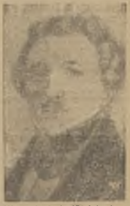
Wczoraj minęło 150 lat od urodzenia L. J. M. Daguerre'a - wynalazcy fotografii