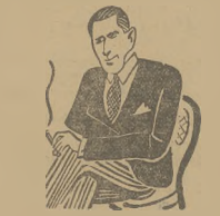
TATARESCU SZEF BLOKU RZĄDOWEGO

W wyborczej starelce ostatecznie 66 grupowań z których jednak tylko kilka reprezentuje poważniejszą siłę. Oddziały wojskowe i policja gęsto patrolowały po wsiach i miastach.