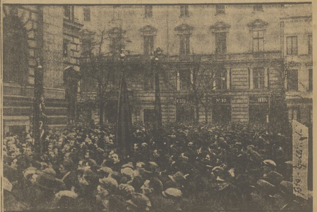
Tłumy robotnicze zalały plac Małachowskiego