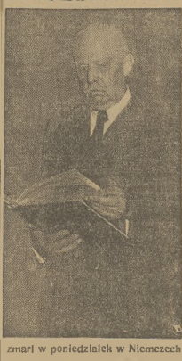
zmarł w poniedziałek w Niemczech