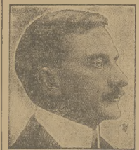
MANIU SZEF CHŁOPSKIEJ OPOZYCJI

Pierwsze wyniki liczebne wyborów będą znane dopiero we wtorek. Obliczenie głosów scentralizowane jest w ministerium spraw wewnętrznych. W kołach rządowych zwycięstwo bloku rządowego uchodzi za zapewnione, bo w Rumunii żaden rząd jeszcze nie przegrał wyborów. Ponieważ lista, która uzyskała 40% głosów otrzymuje z mocy prawa premię w wysokości połowy zdobytych głosów, blok rządowy ma zapewnioną większość.