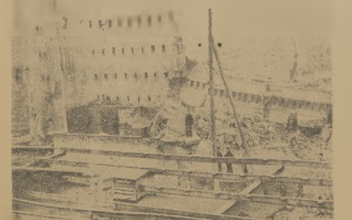
Widok z lotu ptaka w dzielnicy radzieckiej Berlina, po wyzwaleniu budowlę w powietrze przez żołnierzy radzieckich.

Węzle rodzaju należałoby natychmiast anulować.” Ostrożność nakazuje natychmiast wycofanie 5 tyś. żołnierzy brytyjskich z Grecji, — kontynuacja jest „Daily Express”. GENEWA. — 10. stycznia przybył do Ginewy generał sekretarz ONZ, Trywe Lie. Lie omówi z rządami szwajcarskim sprawą zawieszoną w wykonaniu sesji Generalnego Zgromadzenia ONZ do Ginewy.