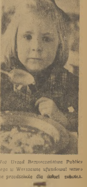
Woj Urząd Bezpieczeństwa Publicznego w Warszawie informował, że w