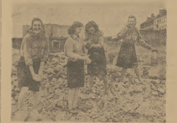
Na Placu Giełznowskim w Warszawie wraz z żonami. Słubny Polsce” pracują dźwizcia i chłopcy ze Związku Młodzieży Czechosłowackiej