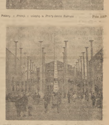
Wielki kompleks wieżow na Wydziale Zimowin w Warszawie

gospodarki narodowej — Pa- reynaud — (niezależny republi- an). Obrona narodowa — Ren- Mayer (radycal), sprawy wewnętr- ne — Paul March — (SPIO) Pre- mytal — Robert Lacoste (SPIO), rd- niowski — Pierre Pflimlin — (MRP) Roboty publiczne — Christian Pi- neau — (SPIO), spraca — Daniel Meyer (SPIO), Irlandy-Andre Mar- sell — (SPIO), posiadłość — Pa- morskie — Paul Coste Floret (MRP) Sprawiedliwość — Robert Lacom- ier (MRP) wychowawca — Non Delbos (radycal), odbudowa Rene Cuy (niezależny republikańca).