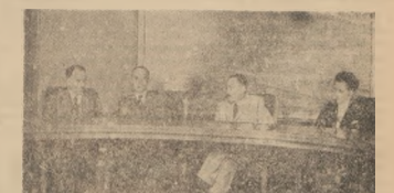
Polacy z Francji z wizytą u Prezydenta Berzusa

LONDYN. — Niewlozanie po po- wrocie z Palestyny do swej krajow- główniej na wyspie Rodos, rozejm ca ONZ by Berodostie oświadczył, ze nastąpi z Żydami i Arabami trzy następujące sprawy: 1) szczegóły dotyczące nadzorow- stwa rozejmu; 2) demilitaryzacja Palestyny; 3) uregulowanie sprawy uchodź- cow i ucielejnierow. Sekretarz generalny Lig Arab- skiej Azam Pasa zaproszował w swoim demilitaryzacji Palestyny, żadając przywrócić użląg odnie- szonej do przedkolei demaj- W sprawie powrotu około 500 ty- s. uchodźcow palestyńskich, którzy op- uszczali tereny zajęte obecnie przez Ży- dów