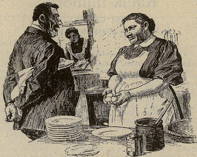
W kuchni restauracji zdrojowej.