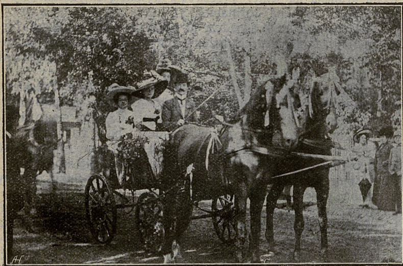
Korso kwiatowe w Druskienikach