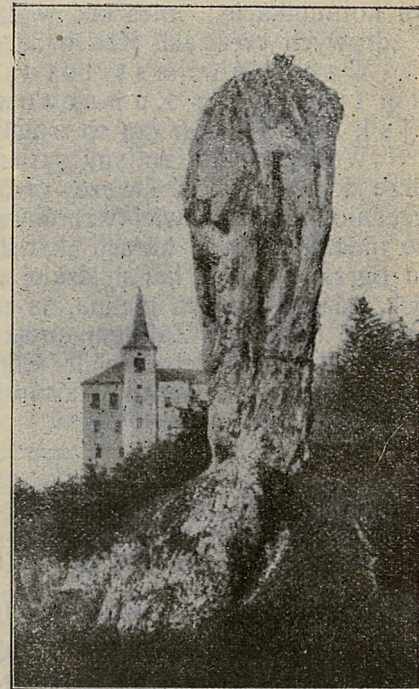
Ojców: Pałka Herkulesowa na tle zamku „Pieskowa Skała“.

(Szczere wyznanie). Wy- słany tutaj przez lekarza, chciałbym się podzielić me- mi spostrzeżeniami. Karls- bad znam dosyć dobrze, byłem tutaj kilkanaście razy, przeważnie nie na kurację, lecz w interesach handlowych. Mimo tego, iż rok rocznie, czy z po- trzeby czy dla rozrywki, wzrasta się liczba osób polskiej naro- dowości, przybywających do Karlsbadu przeważnie ze sfer za- możniejszych, to tak urząd gminny, jakoteż kupcy, przemysłowcy, pod względem narodowym nietylko dla nas nic nie czynią, lecz przeważnie to, co już było, starają się wykorzenić.