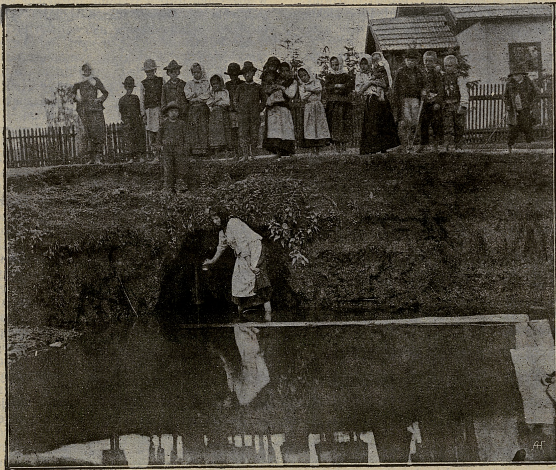
Nowosielce Szlacheckie: Źródło wody żelazistej.