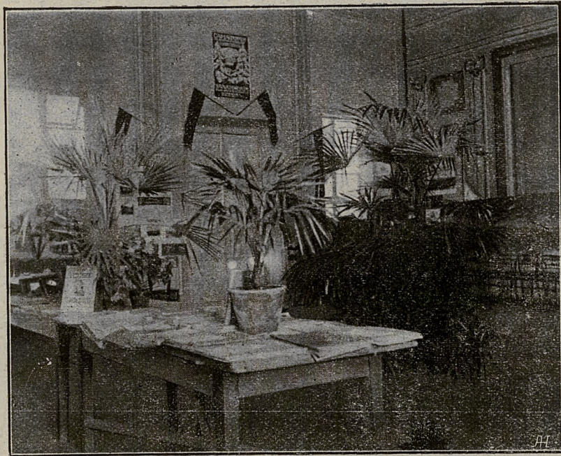
Okrężna Wystawa Zdrojowa w Lubieniu.

Sezon III. powinien ściągnąć także spory zastęp kuracjuszków, ponieważ zdrojowisko nasze, zamknięte ze wszech