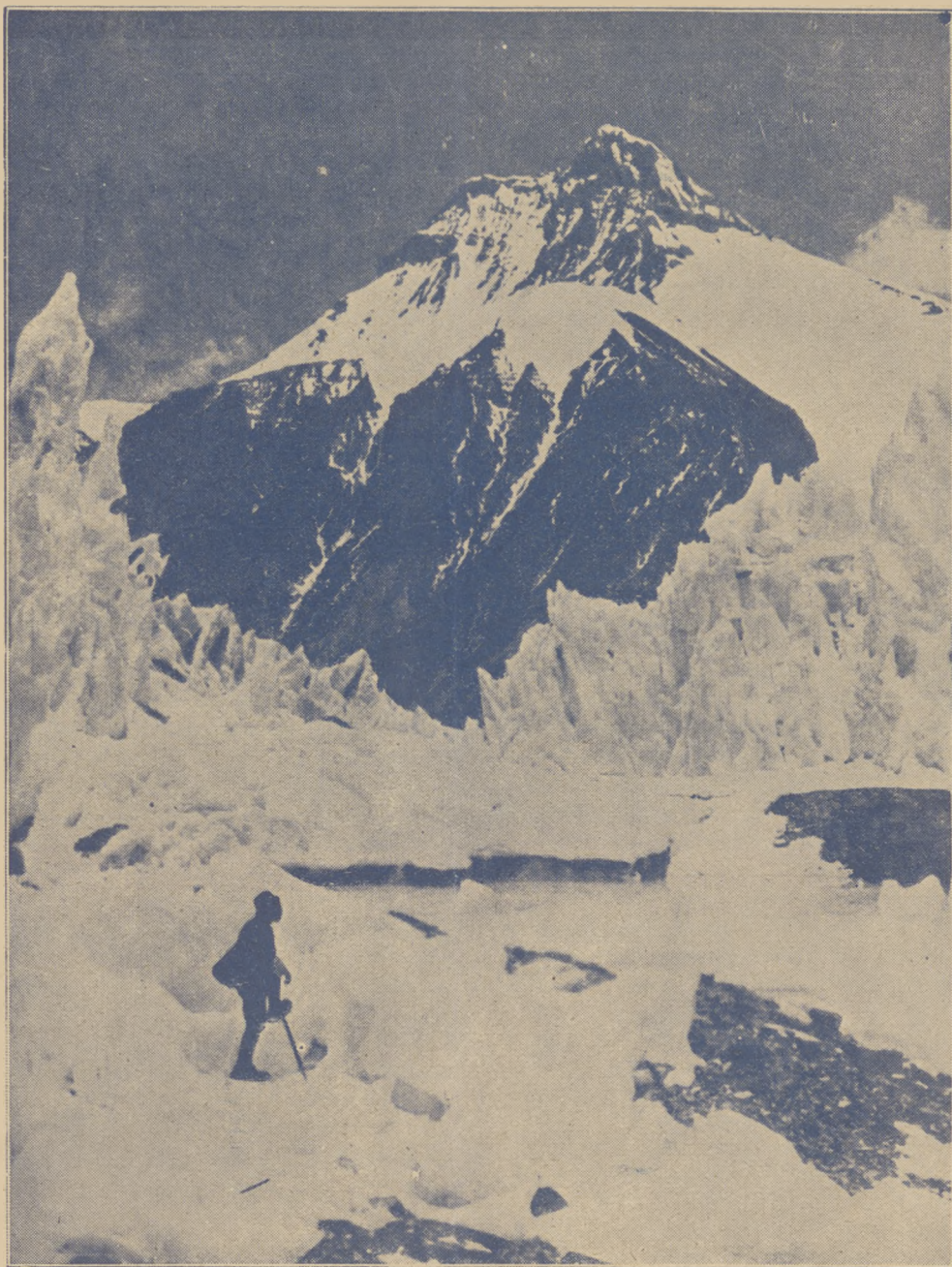
Piękno śnieżnych szczytów.