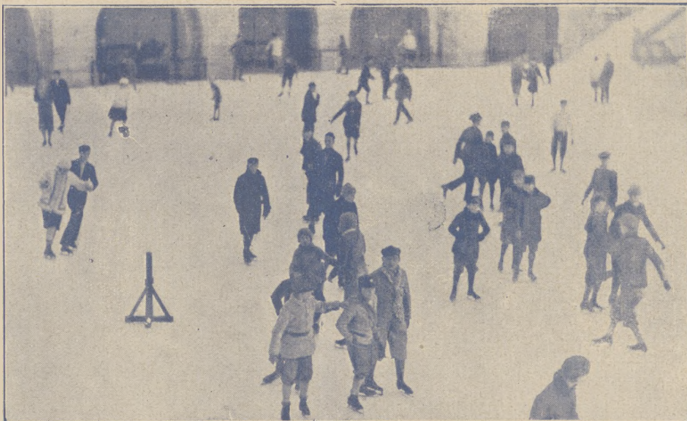
Codzienny widok zimowy na najpopularniejszej ślizgawce warszawskiej w Dolinie Szwajcarskiej.

Sposób ustalania zwycięzcy i dalszych miejsc we wszystkich konkurencyjach jazdy figurowej został uproszczony. Zwycięzcą jest ten, któremu bezwzględna większość przyznała drugie miejsce i t. d. Tylko w razie gdyby przy ustalaniu miejsc żaden z konkurentów nie uzyskał tej większości, decyduje ilość zdobytych punktów ocen w jeździe figur obowiązkowych.