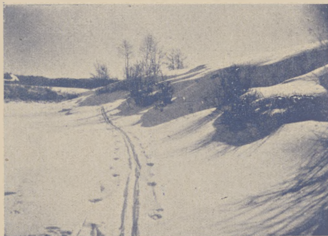
Wileńszczyzna posiada bardzo piękne tereny narciarskie.