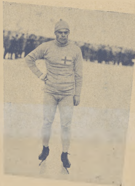
Thunberg (Finlandja) zwany popularnie „Nurmim zimy”.