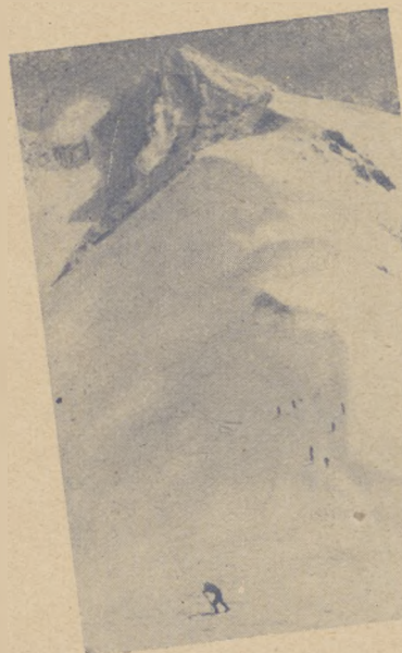
Okolice Zakopanego — polskiej stolicy sportów zimowych.