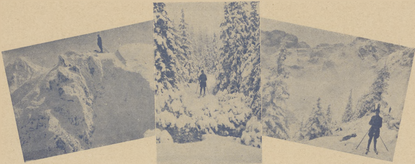
W Tatrach znajdujemy przepiękne tereny narciarskie.