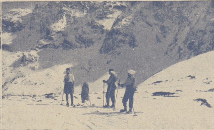
Postój wycieczki narciarskiej w Tatrach.