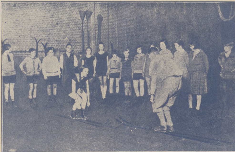
Suchy kurs narciarski w jednej ze szkół średnich.

Z okazji dziesięciolecia istnienia Polskiego Związku Narciarskiego projektowane jest zorganizowanie uroczystości jubileuszowych podczas zjazdu P. Z. N. w dniach 25 i 26 grudnia w Zakopanem. Podczas tego zjazdu wręczona zostanie nagroda Pana Prezydenta Rzeczypospolitej, która ma przypaść temu klubowi, który wykaże się największą ilością punktów w zawodach.