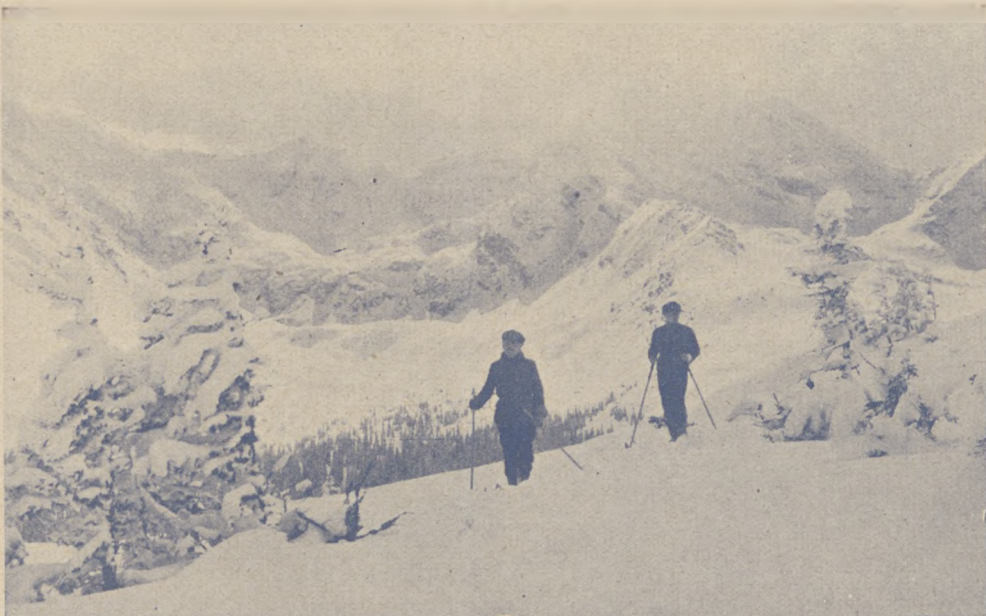
Widok na otoczenie Hali Gąsiennicowej.

Teraz już kluby omal wszystkie trenują zbiorowo, a niebawem rozpoczną nawet wspólne wszystkich klubów razem ćwiczenia. Słowem Podtatrzański okręg narciarski intensywnie gotuje się do zaciętych zmagania bezkrwawych na śniegu.