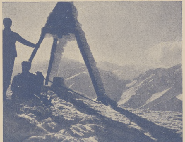
Na szczycie Kasprowego Wierchu.