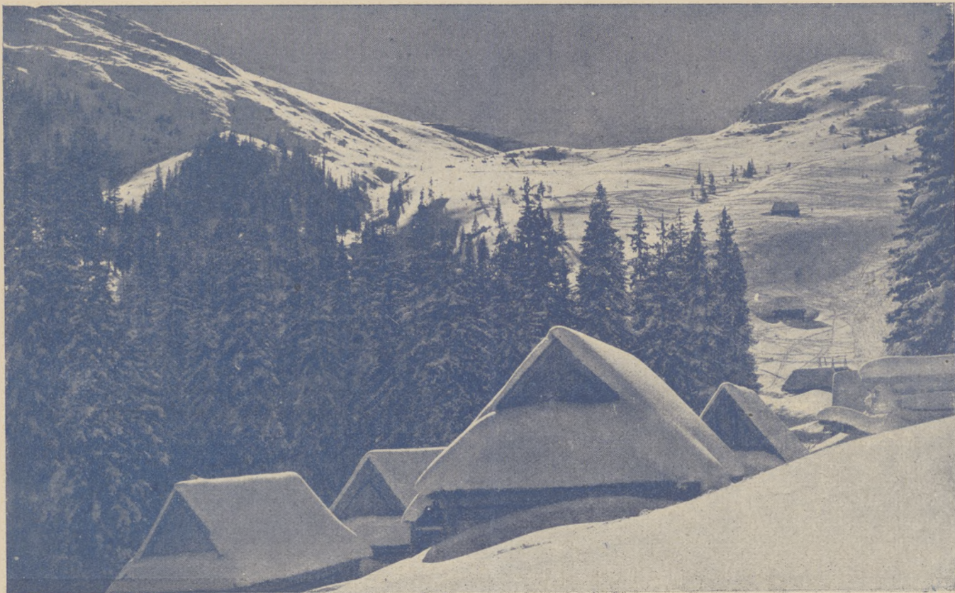
Dolina Goryczkowa w zimie.