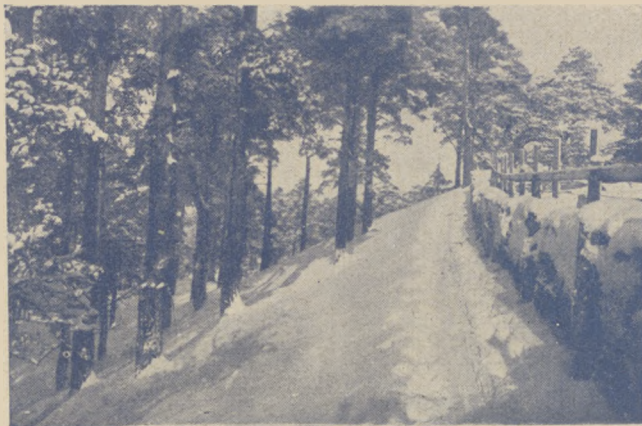
Fragment jednego z lasów obok Wilna.

wysoko, a szczególnie podniosła się technika biegu po kursie zeszłorocznym por. Kwaśnicy z 3 p. s. p. Sam fakt powstania w Wilnie wytwórni nart „Lignopil“, która w tym