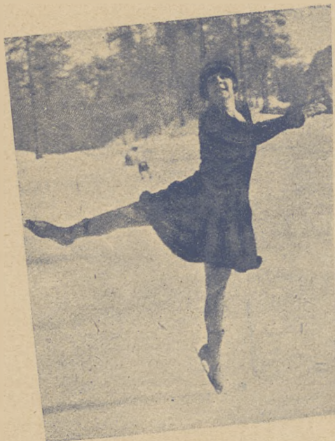
Sonja Henje (Norwegja) najlepsza łyżwiarka świata.