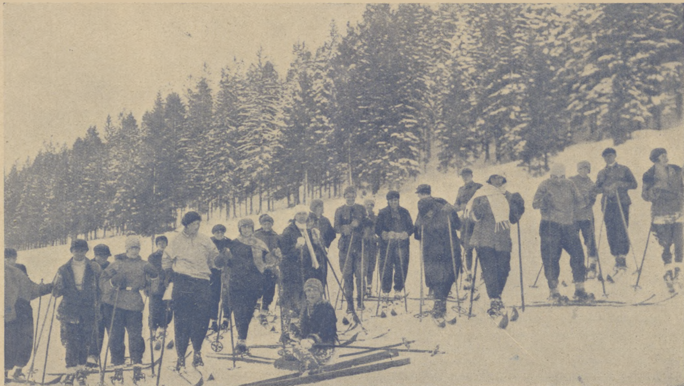
Studenci Państw. Inst. W. F. na kursie narciarskim w Zakopanem.