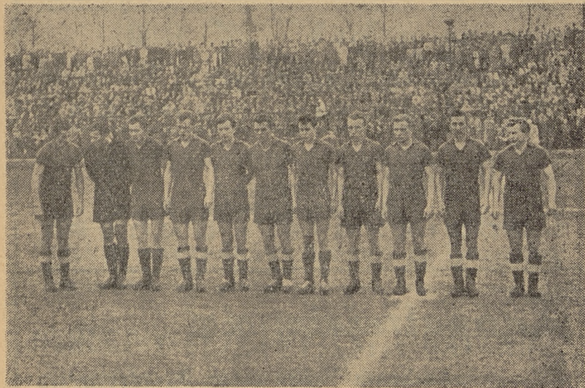
Jed nastka chorzowskiego AKS-u