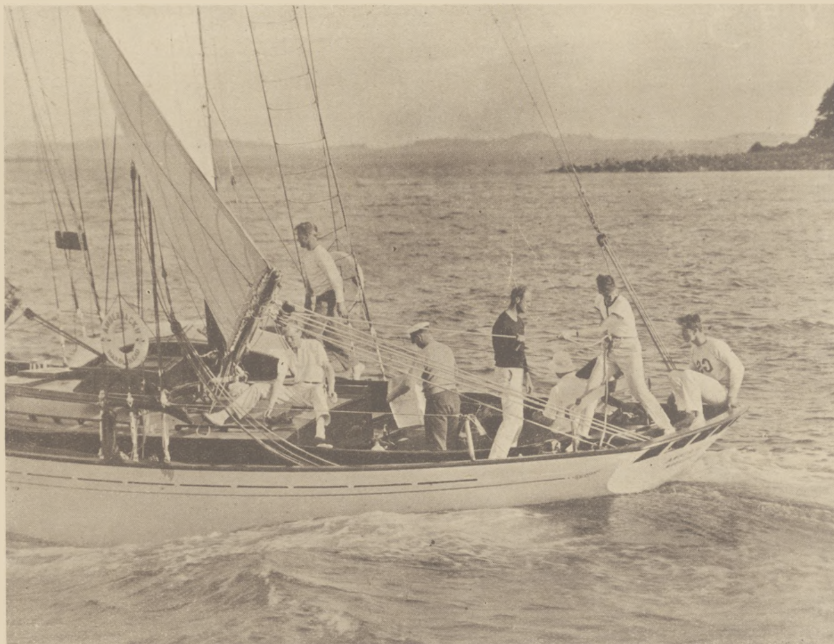
Prezydent U.S.A. Roosevelt (w kapeluszu obrócony tyłem) używa przejażdżki na jachcie Amerjack II.

Tak, — piękno jego nie objawia się tylko w obrazie natury, lecz w godności pracy żeglarskiej i walce o dobrobyt społeczeństw.