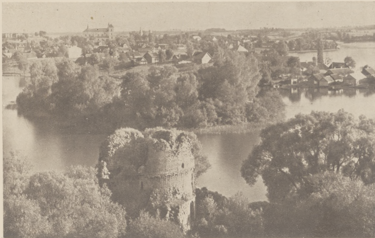
Widok na Troki i jezioro, gdzie odbywają się regaty organizowane przez Wileński Międzyklubowy Komitet Regatowy.