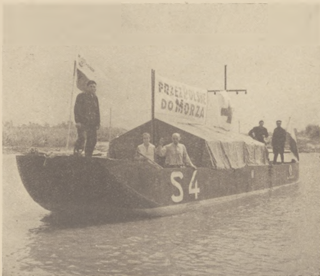
Barka Polskiego Czerwonego Krzyża, uczestnicząca w spływie „Przez Polskę do Morza”.