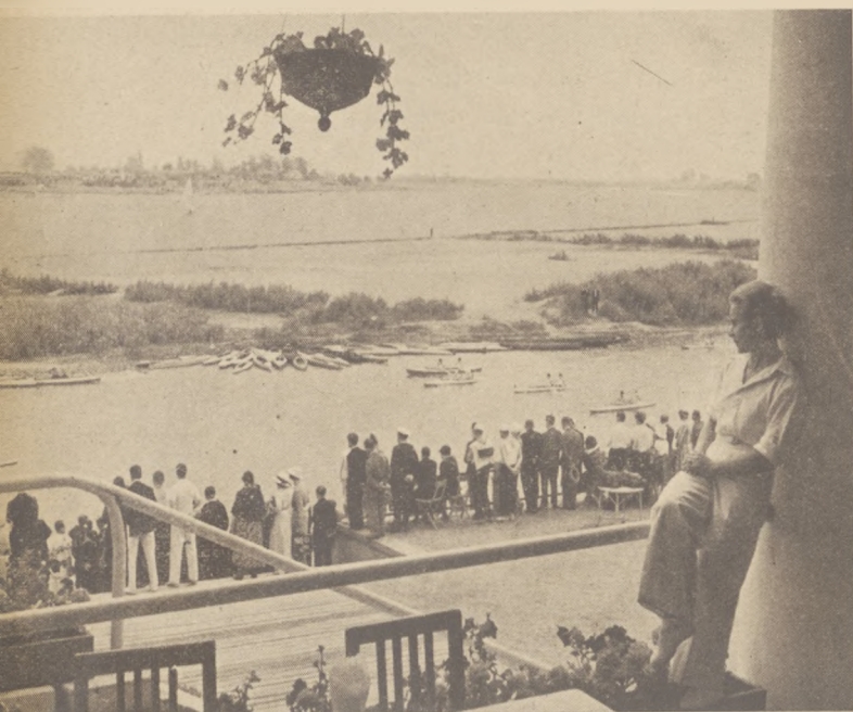
Widok z terenu Klubu Wioślarskiego „Syrena” w Warszawie na wyjeżdżające łodzie na splyw „Przez Polskę do Morza”.

W dwie godziny później obydwie osady są znowu na starcie. London startuje w tempie 36, Amerykanie 36. Na 600 m. Anglicy wypracowali \frac{1}{4} długości, ale nie na długo, gdyż znowu Amerykanie wyrównali. Znowu dochodzi do wspaniałej walki — obydwie osady padają na