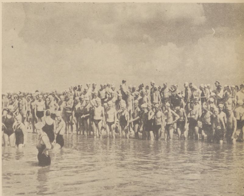
W wyścigu pływackim Wilanów — Warszawa, wzięło udział stu dwudziestu ośmiu zawodników i zawodniczek.

Najwięcej widzów i dochodu dał turniej lekkoatletyczny.