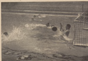
Interesujący moment na chwilę przed uzyskaniem gola

Jeżeli zrozumiemy, że zawody, i to nie jakieś „propagandowe” dla patulachów, ale atrakcyjne zawody wielkich słów są najlepsza propaganda, gdyż ścigająca najpierw widzów, a potem czynnych zawodników, przesłaniemy gąrdzić „słajną wysigową”. Każdy dobrze zrozumie, że zdobyty centymetr, czy sekunda urwana z rekordu, nie posiada sama przez się wartości użytkowej. Kto jednak umie pałować na pewne jawiska w sposób przenikliwy, kto umie ocenić nie tylko ich zewnętrzne pozory, ale także ich wewnętrzne — mniej uchwytną dla oka treść, kto potrafi ujmować zjawisk mechanicznie i powierzchownie, ten zro-