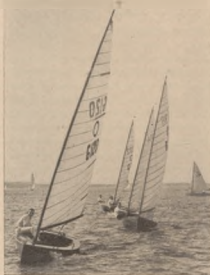
„Olimpijski” podczas treningu na zatoce Kilońskiej