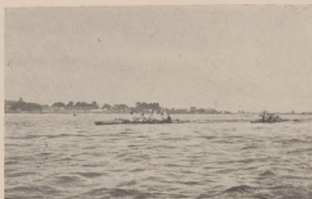
W. T. W. wygrywa bieg czwórek