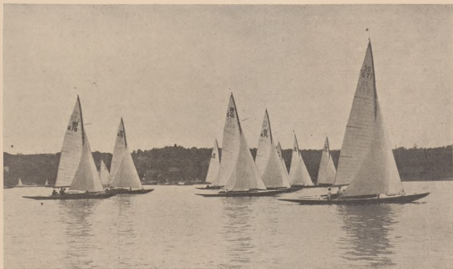
Start żaglowców 30 m- na Wansce pod Berlinem