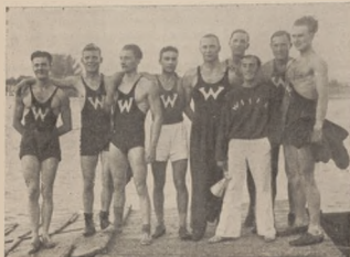
Zwycięska osada ósemki K. W. „Wisła” Warszawa — wygrała bieg główny o mistrzostwo Warszawy

Żeglarze wysyłają na koszt własny jedną olimpijkę i ew. jedną R6.