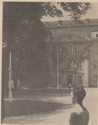
Oto rezydencja w Köpenick, gdzie mieszkać będą polscy wioślarze olimpijcy

Natychmiast po zajęciu jeziora Tana, członkowie związku wioślarskiego Aniene, pełniący służbę wojskową w Afryce wachodniej, założyli oddział wioślarski na wodach jeziora Tana. Na czele oddziału stoi znany sportowiec włoski k. Caraffa d'Andrea. Nowy oddział zamierza wystawić specjalną ósemkę, która trenować będzie na wodach jeziora Tana i będzie zgłoszona do igrzysk olimpijskich w Berlinie.