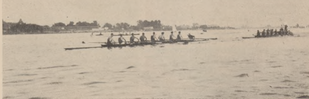
Ósemka K. W. „Wisła” Warszawa na finiszu

K. W. Wisła miała swój dobry dzień wygrywając bieg czwórki w młodzieży Warszawy w dobrym czasie. Osada prezentuje się dobrze pracując pilnie i ma wolę zwycięstwa. Natomiast AZS dysponując dobrym materiałem osiągnął sukces tylko w czwórkach nowicjuszy. Dwie osady ósemek nie miały powodzenia. Nie należy się tem jednak przejmować i wziąć się tembardziej do pracy a napewno sukcesy nadejdą.