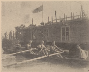
Zwycięska czwórka K. W. Toruń