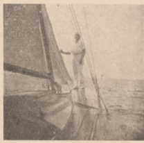
W czasie podróży