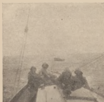
Znikło już wybrzeże

DWUTYGODNIK POŚWIĘCONY SPRAWOM WIOŚLARSTWA ŻEGLARSTWA PŁYWACTWA TURYSTYKI WODNEJ JACHTINGU MOTOROWEGO