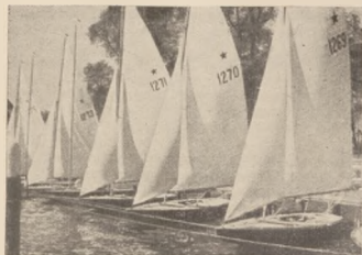
Star'y, biorące udział w jednym z wyścigów podczas tygodnia kilońskiego