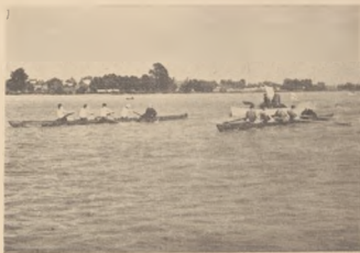
Bieg czwórek półwycielgowych.