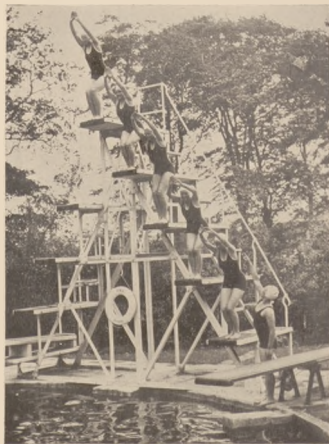
Liverpol. Zbiorowa nauka skoków do wody.

W Ostrowcu odbył się dn. 11 czerwca mecz waterpolowy o mistrzostwo Polski pomiędzy drużyną Giszowca a RSZ, zakończony zwycięstwem drużyny Giszowca w stosunku 2:0.