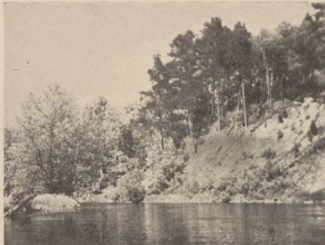
Brda w Tucholskich borach.