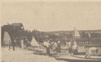
Przygotowania do spływu na przystani K2. Chojnice.