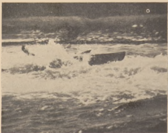
Międzynarodowy spływ Brdą, przejazd przez spust w Kluni.

Zbiórka zawodników na starcie biegu długodystansowego o godz. 10.30, na starcie biegu krótkodystansowego o godz. 13.30.