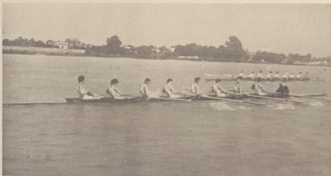
Wioślarski zespół w Warszawie.

DWUTYGODNIK POŚWIĘCONY SPRAWOM WIOŚLARSTWA ŻEGLARSTWA PŁYWACTWA TURYSTYKI WODNEJ JACHTINGU MOTOROWEGO