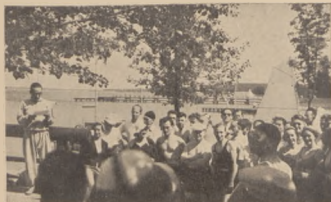
Powitanie uczestników spływu.