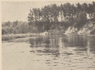
Brda w okolicach Kiełpińskiego mostu.