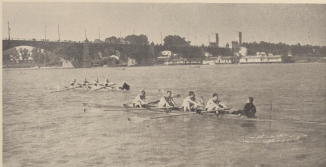
Bieg czwórek nowicjuszy.