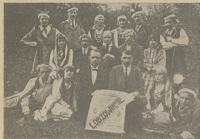
Grupa członków Koła Teatru Ludowego w Bielsku-Podlaskim.

Dopiero 17 maja 1921 r. przynosi korzystną zmianę.