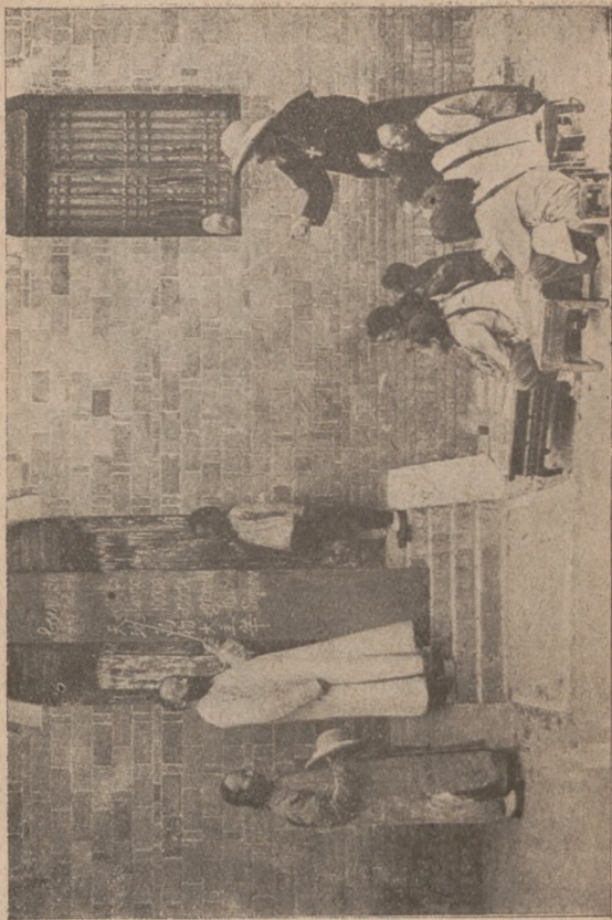
Ks. Biskup w Chinach na wizytacji szkoły.