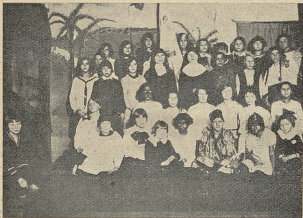
Stow. św Dzieciństwa w Warszawie szkoła 113 z przedstawienia.

przerwach między aktami chodził „chińczyk“ z puszką i zebrał aż 75 zł. i 70 gr. — Sztandarek mamy bardzo ładny, biały z jedwabiu z wyhaftowanym wizerunkiem Dzieciątka Jezus. Po lewej stronie jest napis złotymi literami: „Stowarzyszenie Św. Dzieciństwa przy szkole 113 w Warszawie“. Uważamy teraz, że gdy mamy już