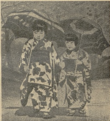
Byłe wychowanki Zakł. Dziec. w Fuku-oka w Japonji.

Lecz na wszystkie pytania, które jej potem stawiam, odpowiada przez jakieś słówko »ha« równie krótkie jak wyrażające niepocieszenie i rozpacz. Wreszcie podzieliła się ciasteczkiem z pieskiem i poszła. — Na trzeci dzień przyszła dziewczynka z pieskiem znowu o tej samej porze. Zaciekawiony tem, dopytywałem się sąsiadów, czy kto tę dziewczynkę zna, i czy wie, skąd ona jest. Wszyscy odpowiadali, że jej nie znają ani też nie wiedzą, skąd przychodzi. Znalazł się jednak przypadkiem jakiś starzec, który mi tajemnicę wyjaśnił.