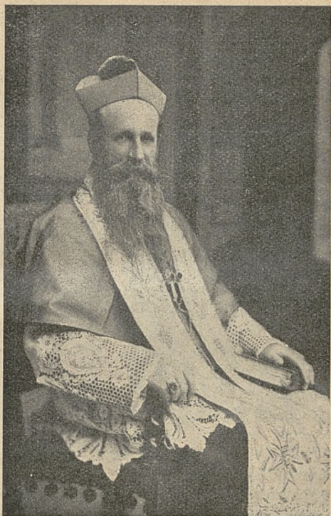
Ks. Biskup Sevat.

gólniejszy sposób błogosławiło Waszej Przewie- lebnosci, wszystkim kierownikom Waszego Dzieła, wszystkim jego zelatorom i zelatorkom i wszyst-