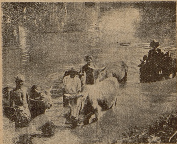
Krajobraz z Indyj ang.