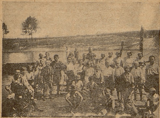
Stow. św. Dzieciństwa Poznań-Starołęka.

„Krucjaty Eucharystycznej”, do której należą przeważnie zelatorzy. Z okazji Bożego Narodzenia urządzono wspólny opłatek z urozmaiceńiami dla obu działów osobno. W oktawie Bożego Narodzenia i Trzech