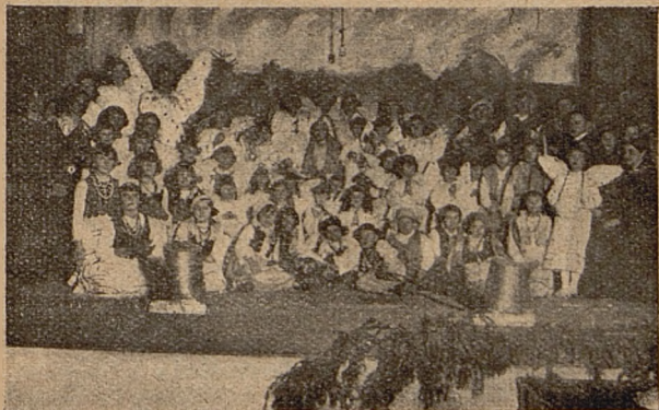
Amatorskie Kółko w Rogoźnie.

giczne. Uroczystość poranną zakończyło błogosławieństwo Najśw. Sakramentem. Po wyjściu z kościoła dokonano zdjęcia fotograficznego.