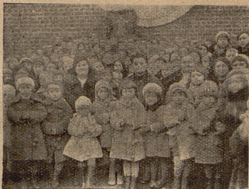
Stow. św. Dzieciństwa w Przasnyszu.

Piękną uroczystość święciło przasnyskie Stowarzyszenie Dzieciństwa Jezusowego w dniu 6 stycznia. Za