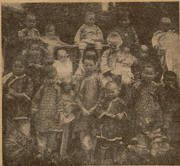
Dzieci z sierocińca.

nej o 200 km. odległej i to w samym sercu Mongolji pogańskiej. W placówce tej założono najpierw