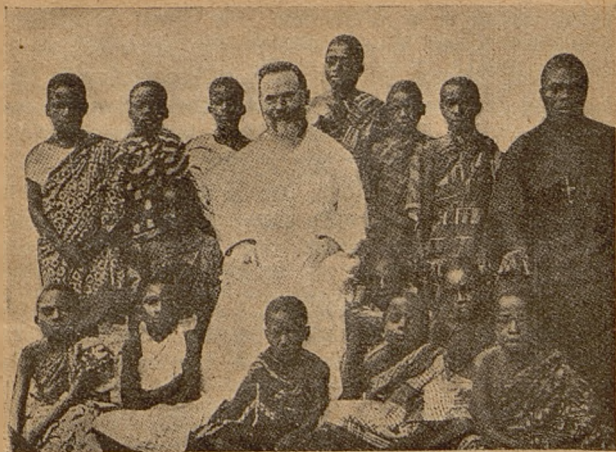
Wychowankowie Pap. Dzieła św. Dzieciństwa.

towuje też przyszłych członków Pap. Dzieła Rozkrzewienia Wiary. Wszystkie nasze poczynania przynoszą owoce z każdym dniem, żeby tylko jeszcze środki