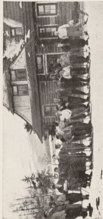
Centralny Instytut Wyszkożenia Narciarskiego AZS-ów Zakopane, 31. grudzień 1933.