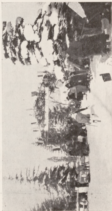
Meta biegu 16 klm. na Międzynarodowych Akad. Mistrz. Polski Rabka, 3. luty 1934.