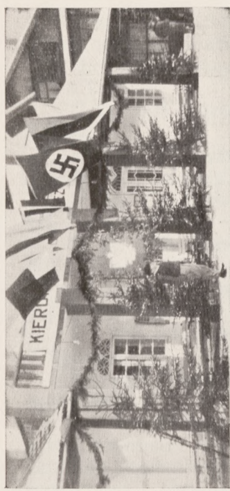
Siedziba Kierownictwa Międzynarodowych Akademickich Mistrzostw Polski. — Rabka, 2. luty 1934.