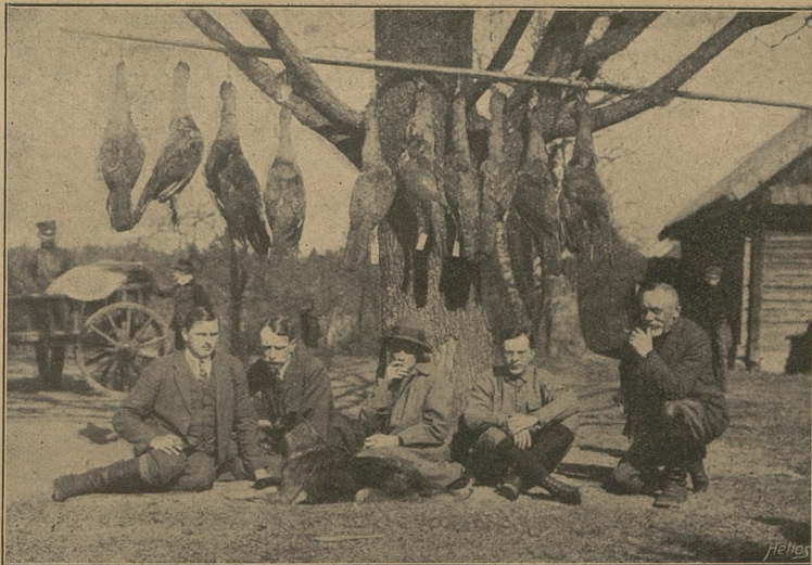
Z toków w Nieświeżu. Kwiecień 1924.

W Ascanie Nowa widziałem bardzo liczne wypadki płodnych potomstw żubryc z żubrem i bubajem rok po roku.