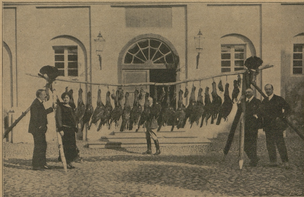
Polowanie na głązce w Nieświeżu.