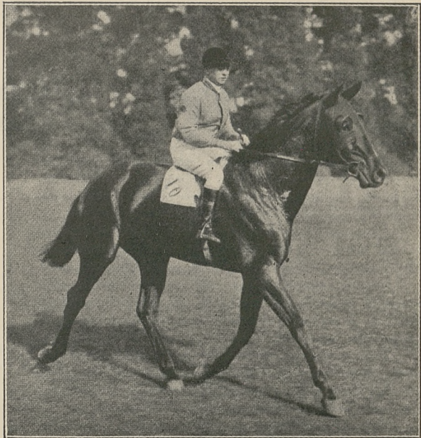
PTOLEMY 3 l. og. c-gn. po Teddy i Macédonia.