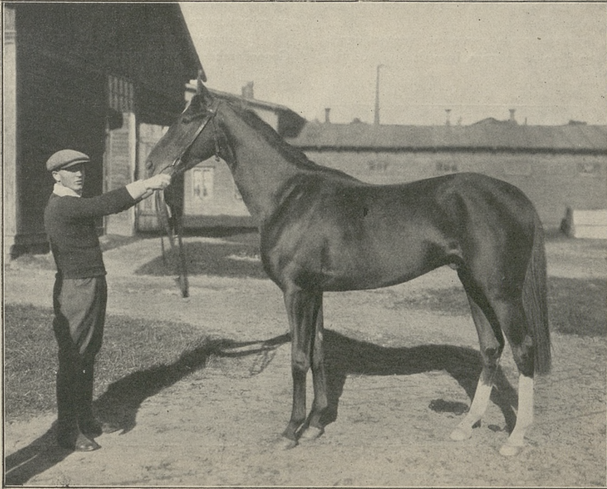
DOLLAR 2 l. og. kaszt. po Huszar II lub Dealer i Delightful Morning.

Istotnie pod kierunkiem profesorów wyższych uczelni rolniczych i wysiłkiem dawnych niedomordowanych i pozostałych właścicieli i byłych trenerów w wielu wypadkach przekształconych w niższy personel stajenny a nawet przedwojennej niższej służby stajennej, w państwowych stadninach 1-ej kategorii zgromadzono najcenniejsze znakomitości wyścigowe i przedstawicieli rasy kłusaczek, angielskiej pełnej krwi i ciężkich imp. Tak w Smoleńskim goskonza-