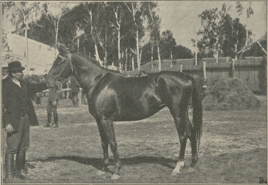
Klacz gniada 4 l. p. A. Kraczykowskiego.

Trojnar Paweł (Wierzba), klacz siwa, l. 7 szlachetna orientalna z roczniakiem, wł. chowu, nagroda 150 zł.