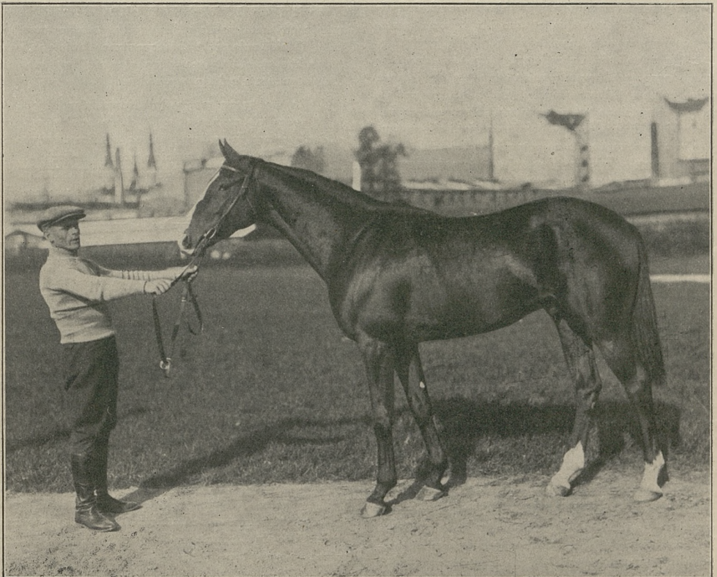
EMBACH 21. og. gn. po Carabas i Dżwina, zwycięzca nagr. im. bar. Fanehawe.

Administracja pisma uprzejmie prosi pp. prenumeratorów o wpłacanie zaległej prenumeraty.