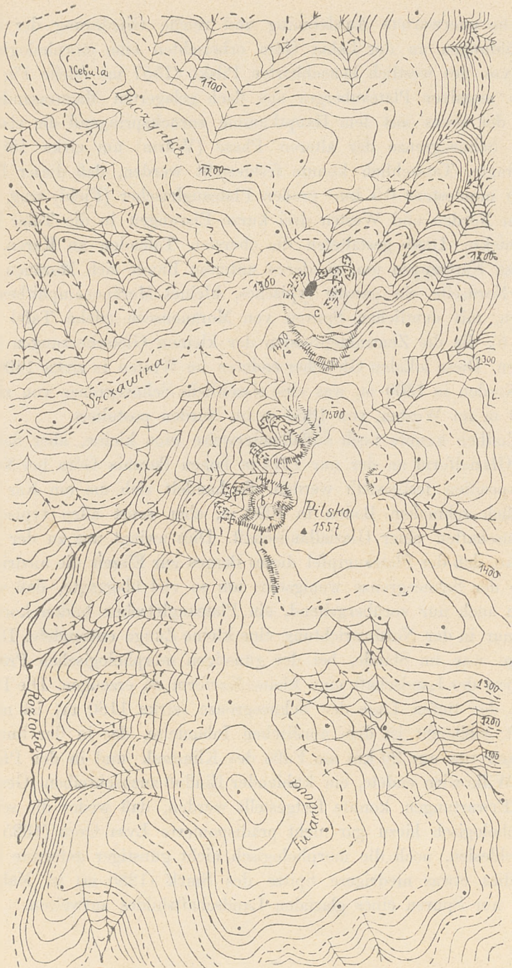
Fig. 1. Kärtchen der Gletscherspuren auf dem Pilsko. Maßstab 1 : 29300, Isohypsen- distanz 20 m. Glaziale Wände gestrichelt, Moränen durch Kreuzchen angezeigt.