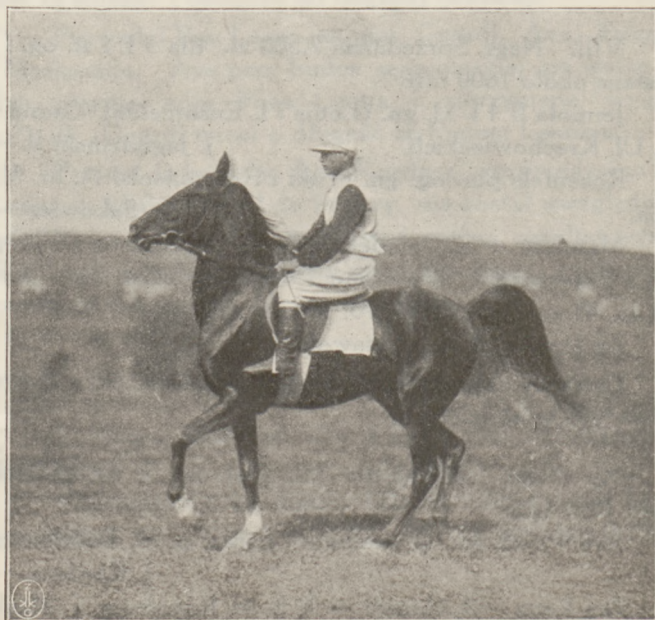
GRUZINKA R. ks. Sanguszki. Z wyścigów koni arabskich.

W dystansowej próbie prowadzi Lisette II, mając za sobą Granata Tena, Borutę, Tamerlana i Gwałta. W ostat-