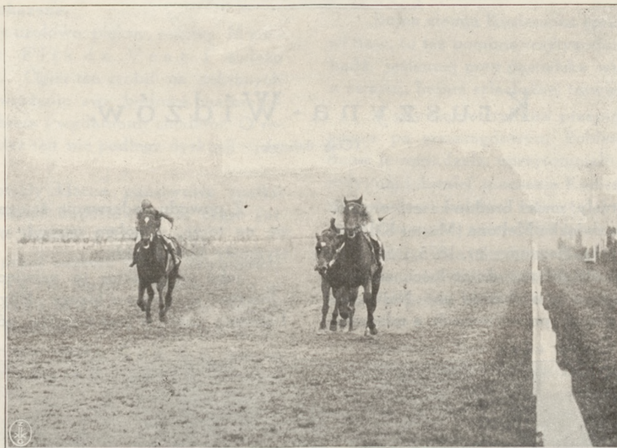
GRANAT BIJE NIOBE I TENA.

W „Wszzechrosyjskiem derby“ 9 lipca zdobywa pierwsze miejsce i bije pod Hoarem, Galtee Boy'a, Jaworynę, Romualda, Tastlessa, Prince Noir'a, Marquis Carabas, Cadogana — w 2 m. 38 s. Derbista w wieku dwóch lat wygrał tylko 223 rs., co powinno służyć za przestrożę i wskazówkę. Na Kołomiagkim torze (pod Petersburgiem) Fluor w Produce zajmuje znów pierwsze miejsce, wygrywając 10.005 rs., w nagrodzie imienia „Cesarzowej“ zajmuje