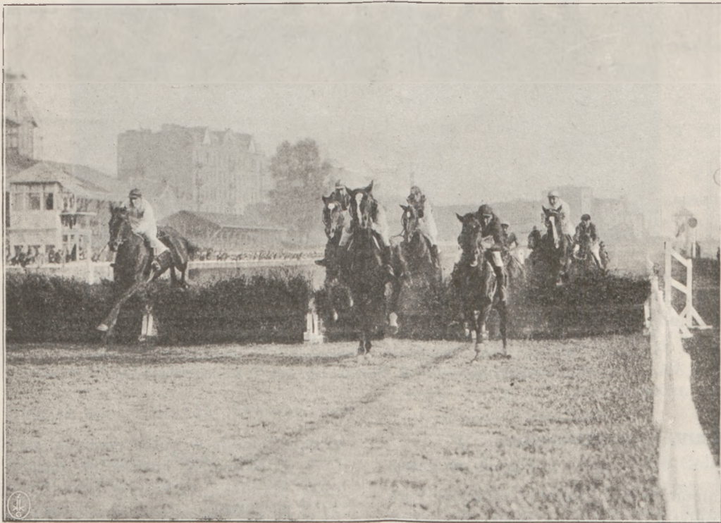
Handicap płotowy (wartość 4.000 zł.).