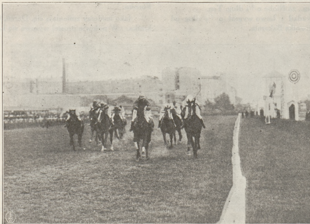
Episod z wyścigu o nagr. im. L. hr. Krasieńskiego.

Czołowe miejsce zajęły: Flos, Arlekin i Murman, za nimi reszta. Przy stajniach na trzecie miejsce wychodzi