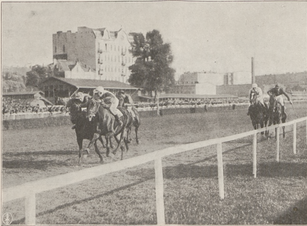
FALA III BIJE MENZALARIC.

Jako leaderzy zmieniają się, Dereń, Cześnik i Arystokratka. W połowie prostej wysuwa się Lapis Lazuri i pew-