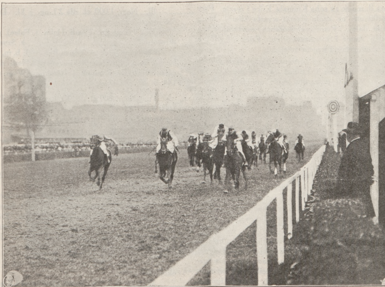
ALEMBIK wygrywa Handicap „Brzezia“.

Mandagora — 2, Ła Monteria — 3; b. m. Danina, Miss Jane, Byle Jaki, Fordham, Hajdamak, Magda, Monte Catini,