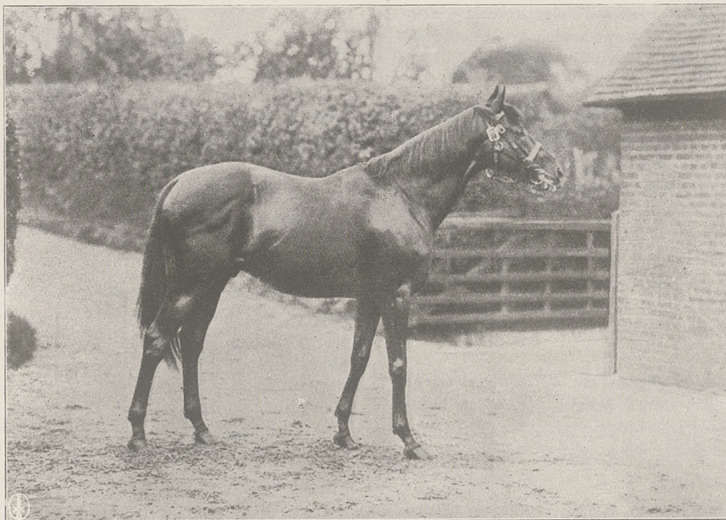
SAINT FRUSQUIN og. sk. gn ur. w 1893 r.