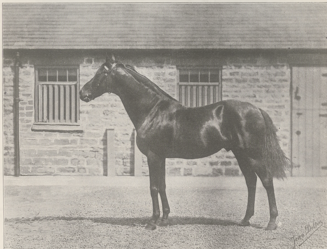
SAINT SIMON og. gn. ur. w 1881 r.

Warunki prenumeraty na ostatniej stronie okładki.