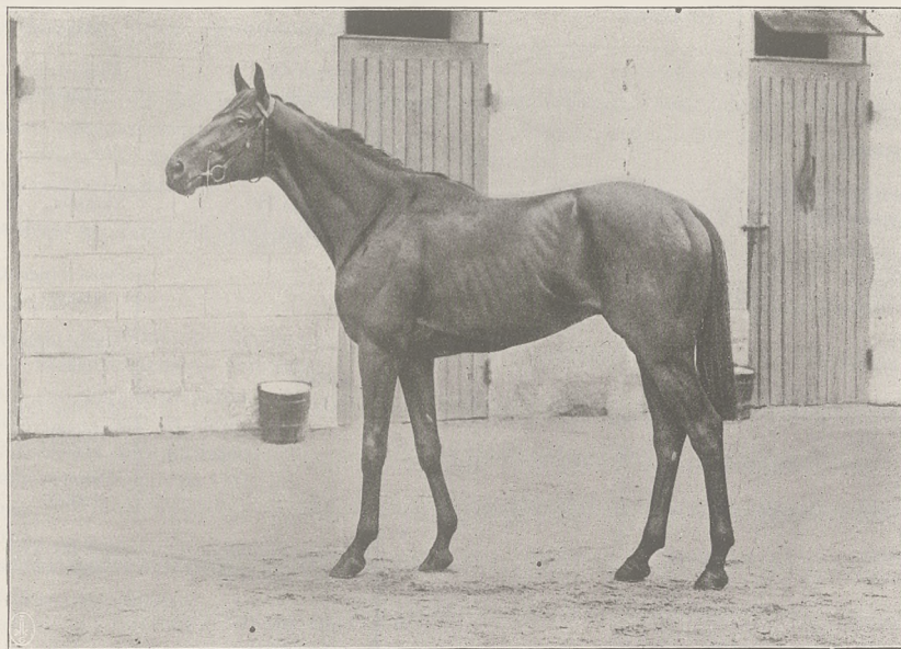
NUAGE og gn. ur. w 1907 r.