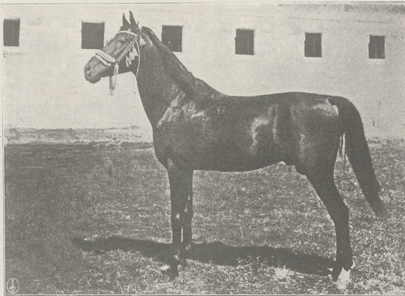
HAR MAN ogier pełnej krwi arabskiej w Kabiuk pdg Petrowa.

W stadzie Albigowskim znajdują się między liczną młodzieżą półkrwi dwa roczniki pełnej krwi — rodzony brat kl. Aurora II gn. Don Julin dużych rozmiarów, syn Kentish Coha i Sweet Bee i przepiękny, cały jakby ze stali wyrobiony złoto kasztanowaty og. Douceur de Vivre po og. Fedorius z kl. Elaunay.