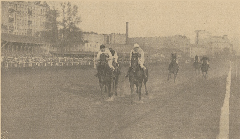
Finish w Nagrodzie im. J. hr. Zamoyskiego (15.000 zł. — 2400 mtr.). FORWARD pln. og. c-gn. p. E. Grzybowskiemu bije o szyję łatwo Erudyta; trzecia Fergana przed Dziwo II, Menzalaric i Boruta.

Zgodnie z przepisami ministerjalnymi ogiery są pre-