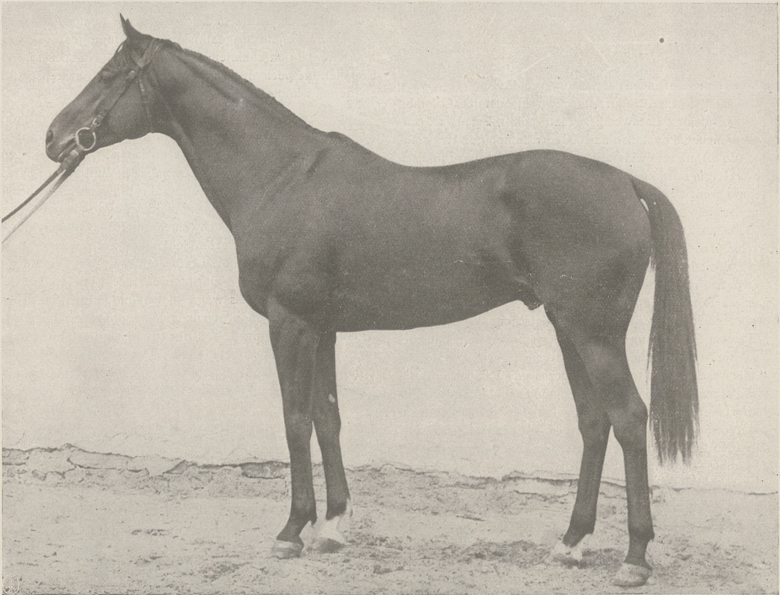
MAH JONG og. gn. ur. w 1924 r. (Prunus — Maja po Caius) w stadzie Schlenderhan, derbista niemiecki 1927 r., czołowy reproduktor Państwowej Stadniny w Koziencach.

TREŚĆ Nr. 27: Z tygodnia, Józef Szempliński. — Wystawy i pokazy koni w 1928 r. (Ciąg dalszy), Witold Pruski. — Wadliwe projekty, Zbigniew Dobiecki. — Kronika: krajowa, rezultaty wyścigów prowincjonalnych i zagraniczna. — Rezultaty wyścigów w Warszawie.