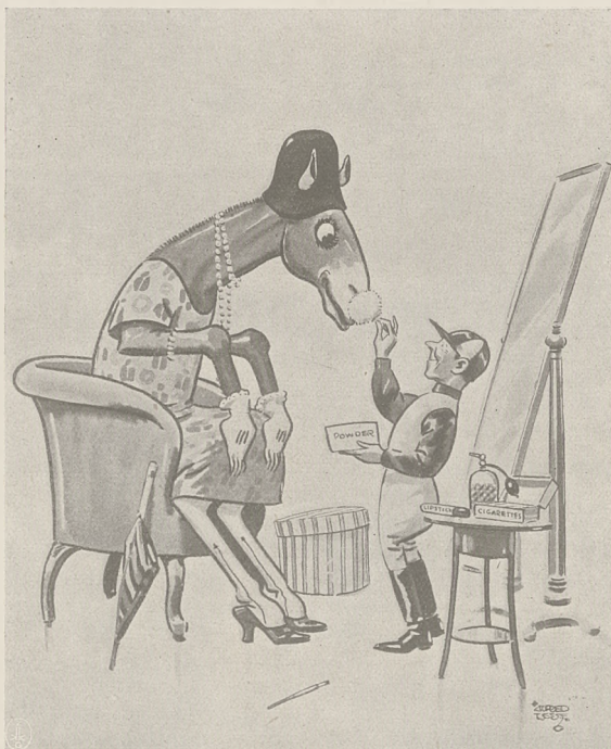
Karykatura angielska, przedstawiająca toaletę klaczy przed jej występem w Ascot, uchodzącym za najbardziej elegancki tor świata.