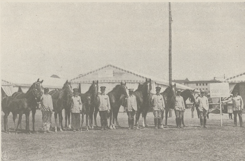
P. W. K. Poznań 1929 r.

niemi Lapis Lazuri. Boston odchodzi coraz dalej, z grupy zaś po jakimś karambolu przewraca się wraz z jeźdźcem Cetynja, a wkrótce odpadają St. Bronchit i Hrabianka. Na ostatnim kilometrze przoduje wciąż Boston i wydaje się niedościgniony przed Caraibe'm. W tem też miejscu energicznie zaczyna finiszować Lapis Lazuri, który wkrótce mija Caraibe'a i potężnym „rushem” zbliża się znacznie do Bostona. Na ostatnich metrach Boston