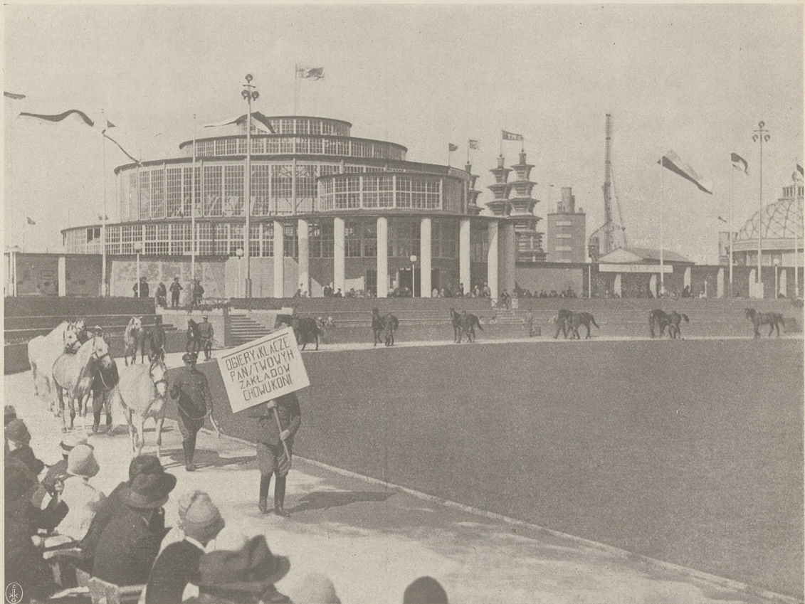
POWSZECHNA WYSTAWA KRAJOWA W POZNANIU w 1929 r. Ogierzy i Klacze Państwowych Zakładów Chowu Koni.

TREŚĆ Nr. 29: Konie na Powszechnej Wystawie Krajowej w Poznaniu, Witold Pruski.—Wyścigi w Łodzi, Józef Szempliński.— Kronika: krajowa, rezultaty wyścigów prowincjonalnych i zagraniczna. — Rezultaty wyścigów w Łodzi.