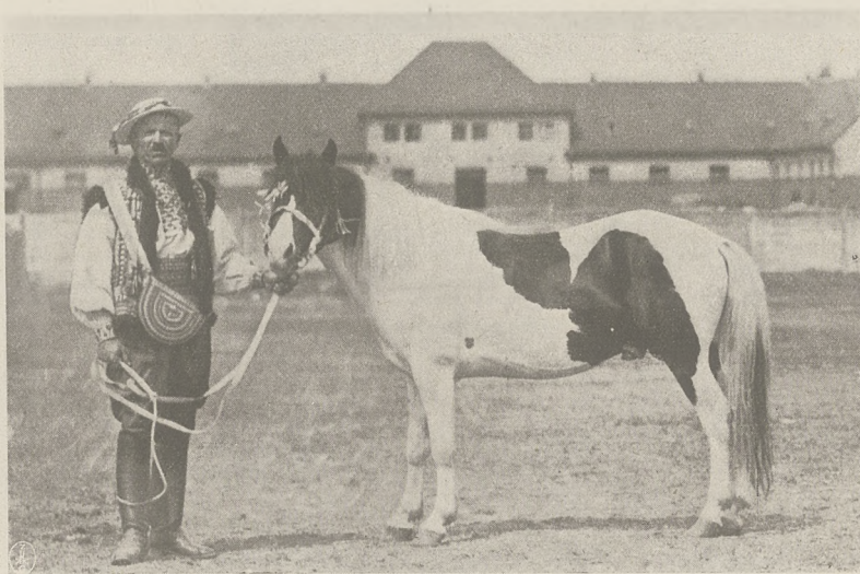
P. W. K. Poznań 1929 r.

— Z prasy: „Kłosy”, tygodnik rolniczy na Pomorzu, wydał specjalny numer (26/27) obrazujący całokształt 10-cio letniego wysiłku pracy około rozwoju i podniesienia produkcji rolniczej na Pomorzu; niezmiernie ciekawe i liczne artykuły zaopatrzone są bogato fotografiami, dając w całości nadzwyczaj piękny numer pisma rolniczego.