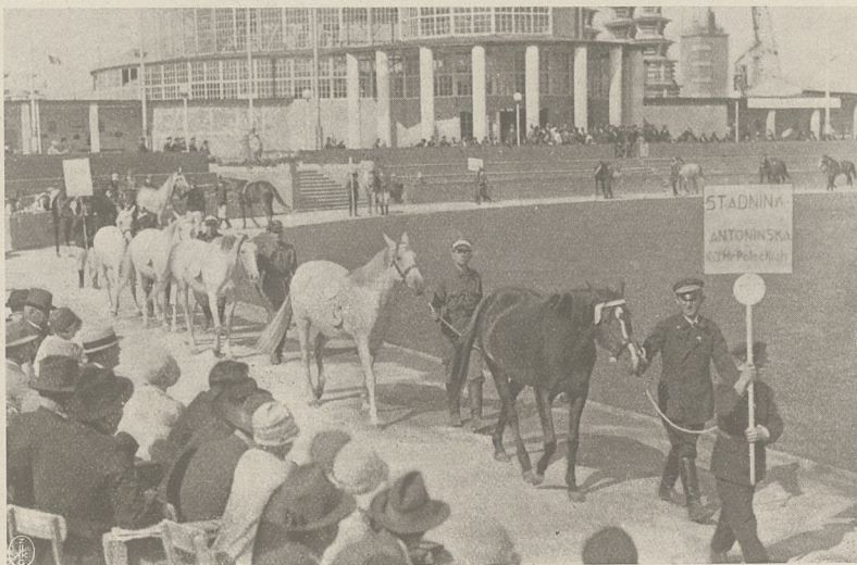
P. W. K. Poznań 1929 r.

Wystawca opłaca: Bydło: za stanowisko dla buhajka w wieku ponad 1 rok — 50 (pięćdziesiąt) złotych, dla każdej innej sztuki 40 (czterdzieści) złotych; na paszę 40 (czterdzieści) złotych.