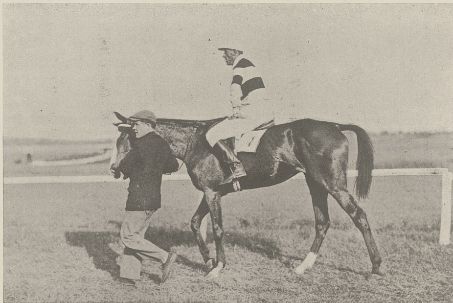
Z WYŚCIGÓW W ŁODZI 1929 r.

Oczywiście niektóre konie szlachetne, odpowiednio przygotowane, mogłyby siłą swoich mięśni podołać ciężarom znacznie większym, naogół jednak natura przystosowała je do innych celów i nie można od nich żądać tego, do czego nie są stworzone. Koń szlachetny, jeśli dźwiga duży ciężar, czyni to olbrzymim napięciem mięśni i nerwów, podczas gdy koń ciężki znaczną część dźwiga