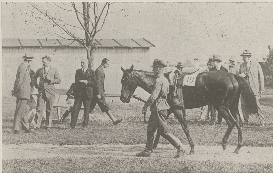
Z WYŚCIGÓW W ŁODZI 1929 r.

Jeden z pierwszych jeźdźców, w fenomenalnym tem-