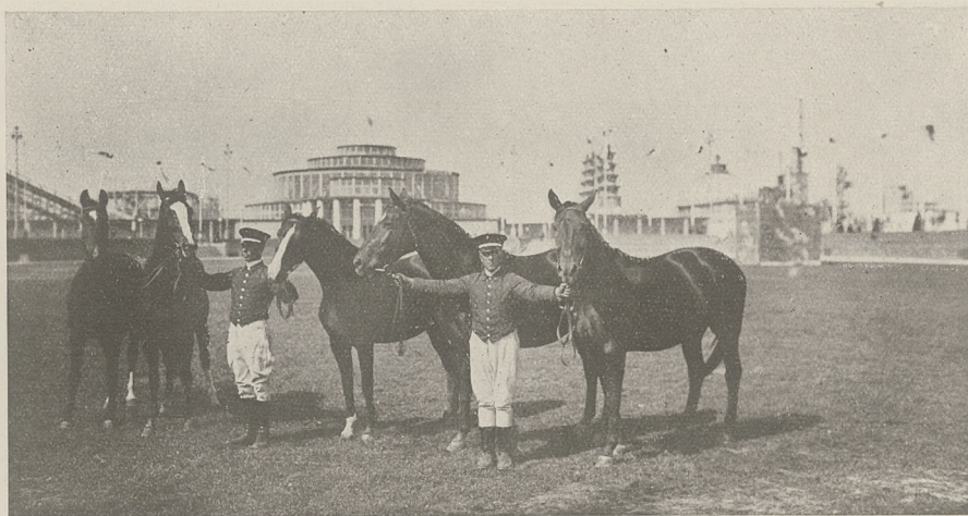
P. W. K. Poznań 1929 r.

Należałoby uelastyczyć je w określeniu wagi wyjściowej przy próbach siły i zamiast normy mylnej ogólnikowej „najmniej 1.200 kg”, z którą koń ma ruszać, wprowadzić wyraźne pojęcie, że waga wyjściowa na każdym pokazie ustalona być powinna osobno przez komisję sędziowską, w zależności od warunków lokalnych, w ten mniej więcej sposób, aby próba mogła być zakończona na dystansie 500 — 750 metrów.