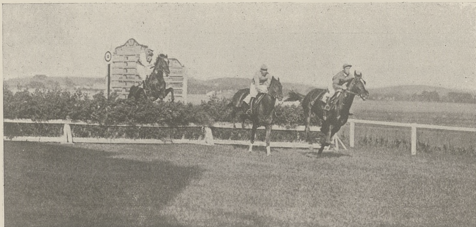
Z WYŚCIGÓW W ŁODZI 1929 r.