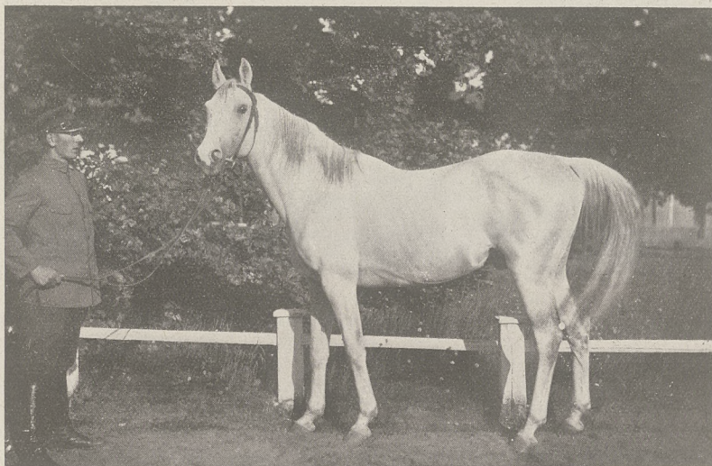
PAŃSTWOWE STADO OGIERÓW SIERAKÓW.