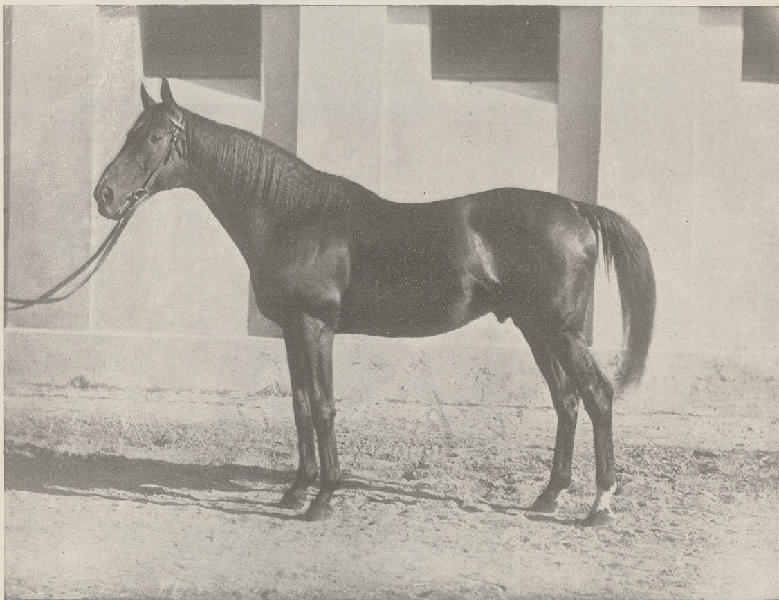
PAŃSTWOWE STADO OGIERÓW SIERAKÓW. Czółowy ogier pół krwi ang. HARLEKIN (Fels i Hecuba).