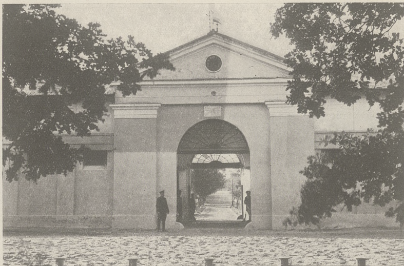
PAŃSTWOWE STADO OGIERÓW SIERAKÓW. Wjazd do Stada. Nad bramą tablica pamiątkowa.

Handicap ten trzeba uważać za zupełnie udany. Dziwo II według wiosennej swej formy więcej wagi otrzymać nie mogła, a „top wight” Herkules walczył na ostatnich metrach z Wulkanem, któremu dawał solidną wagę 7 kg. Obciążony również „top wight'em” Huk, forsując gonitwę jednocześnie z lekkimi wagami, był dobrym czwartym.