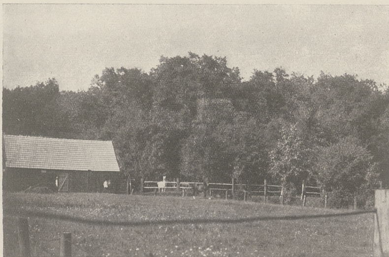
PAŃSTWOWE STADO OGIERÓW SIERAKÓW. Stajnie letnie z paddockiem dla ogierów.

wie stacjonowanych było do grudnia 1918 r. 220 ogierów państwowych.